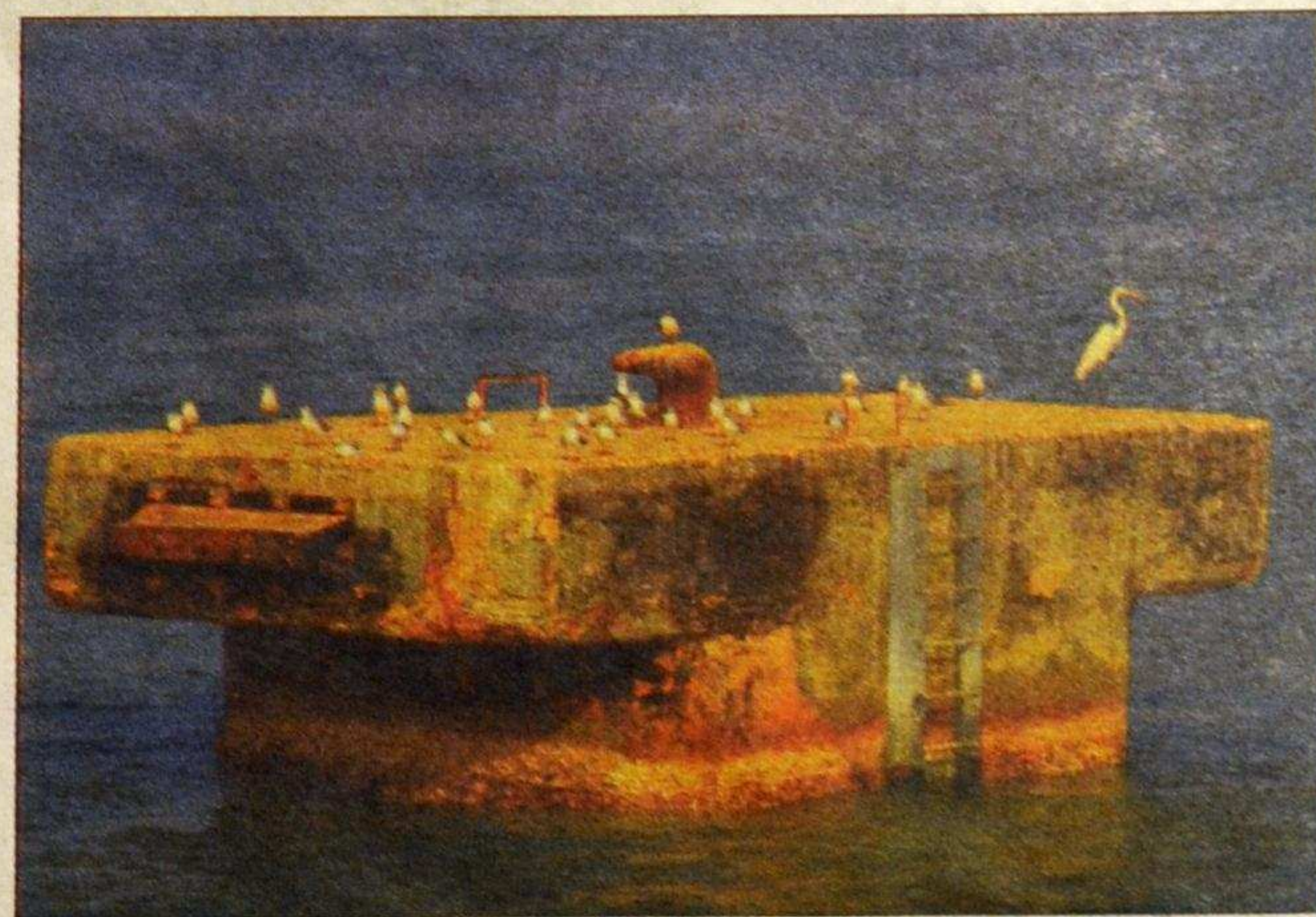
Dette bildet blir å se på utstillingen.

– Skolen jeg valgte ut, er en av de aller fattigste skolene i landet. De rundt 200 barna som er mellom tre og åtte år, er for fattige til å gå på vanlig skole, forklarer hun.